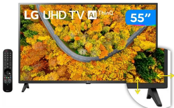
EXEMPLO DE BORDA ASSIMÉTRICA

O item 5 será utilizado para compor um painel (telão), para uso no plenário da câmara, conhecido como videowall, neste sentido, se faz a exigência que o televisor seja sem bordas, ou no máximo, com bordas finas (tela infinita), e ainda com bordas simétricas, sem detalhes, de modo que o encaixe lado a lado dos televisores fiquem o mais alinhado possível, sendo assim, televisores que apresentem bordas extremamente assimétricas ou detalhes de design, conforme os apresentados abaixo, não serão aceitos, pois impossibilitarão a execução da atividade fim, necessária com a aquisição do mesmo: