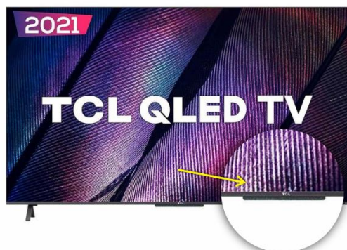
EXEMPLO DE DETALHE DE DESIGN