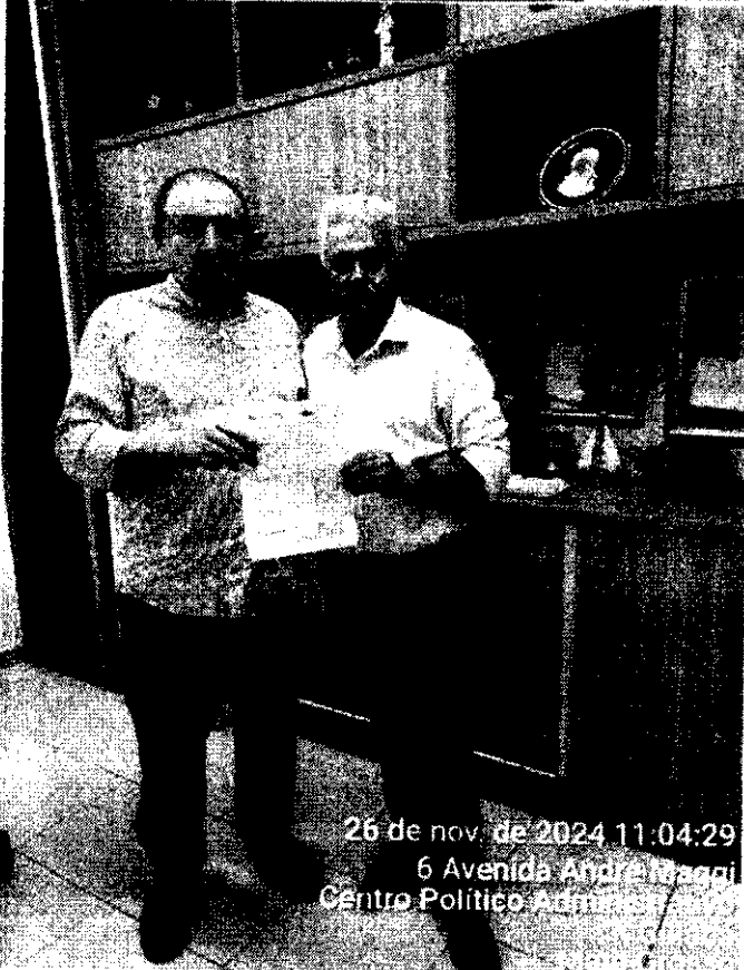
26 de nov de 2024 11:04:29 6 Avenida Andre Maggi Centro Político Administrativo Cuiabá Mato Grosso