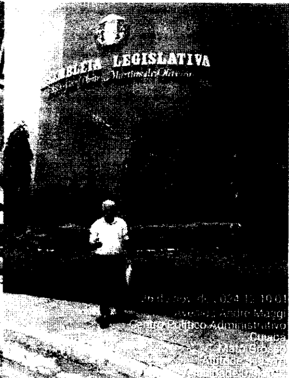
26 de nov de 2024 11:00:01 6 Avenida Andre Maggi Centro Político Administrativo Cuiabá Mato Grosso