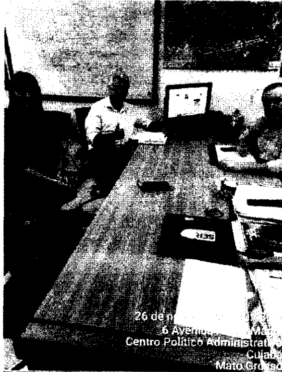
26 de nov de 2024 11:00:01 6 Avenida Andre Maggi Centro Político Administrativo Cuiabá Mato Grosso